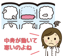
中身が動いて 寒いよわ

部分的にマシ目 の中の羽毛が少 なくなっていま せんか? 太陽光に透か してチェックし てみてください。