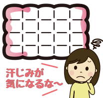
汗ジミが 気になるよわ

特に襟元に汚 れや黄ばみはあ りませんか? 汗の臭いが気 になる場合も中 の羽毛が汚れて いるサインです。