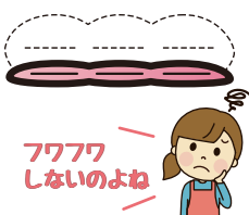
フワフワ しないよわ

購入時より保 温性が足りな くなったりポ リュームが無 くなったりし ていませんか?