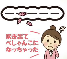
吹き出て べしゃんこに なっちゃった

カバーの内側を 覗くと中に羽毛 が付着していま せんか? もしあったら側 生地の劣化が 考えられます。